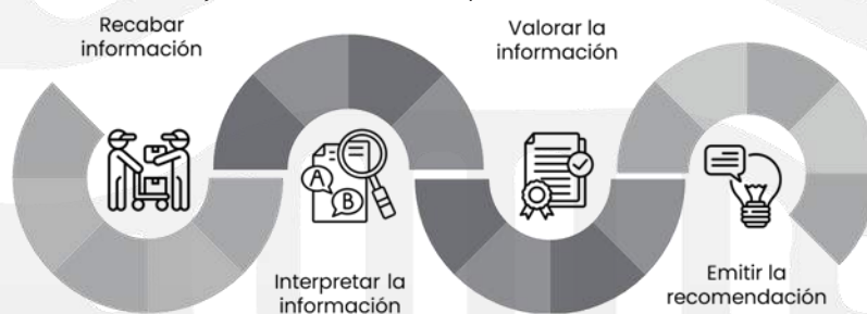
Ilustración 3 Trayectoria analítica para emitir una recomendación.