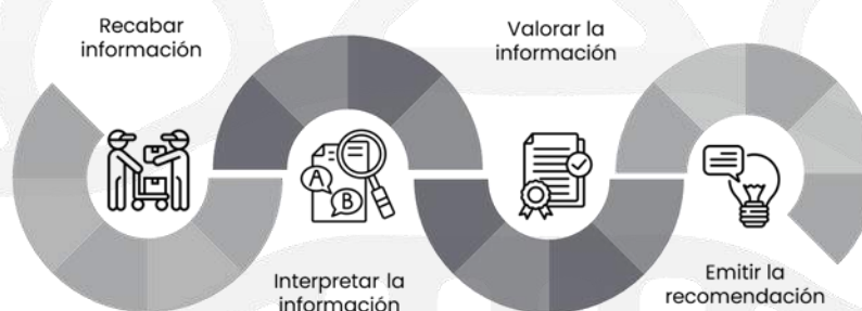
Ilustración 5 Trayectoria analítica para emitir una recomendación.